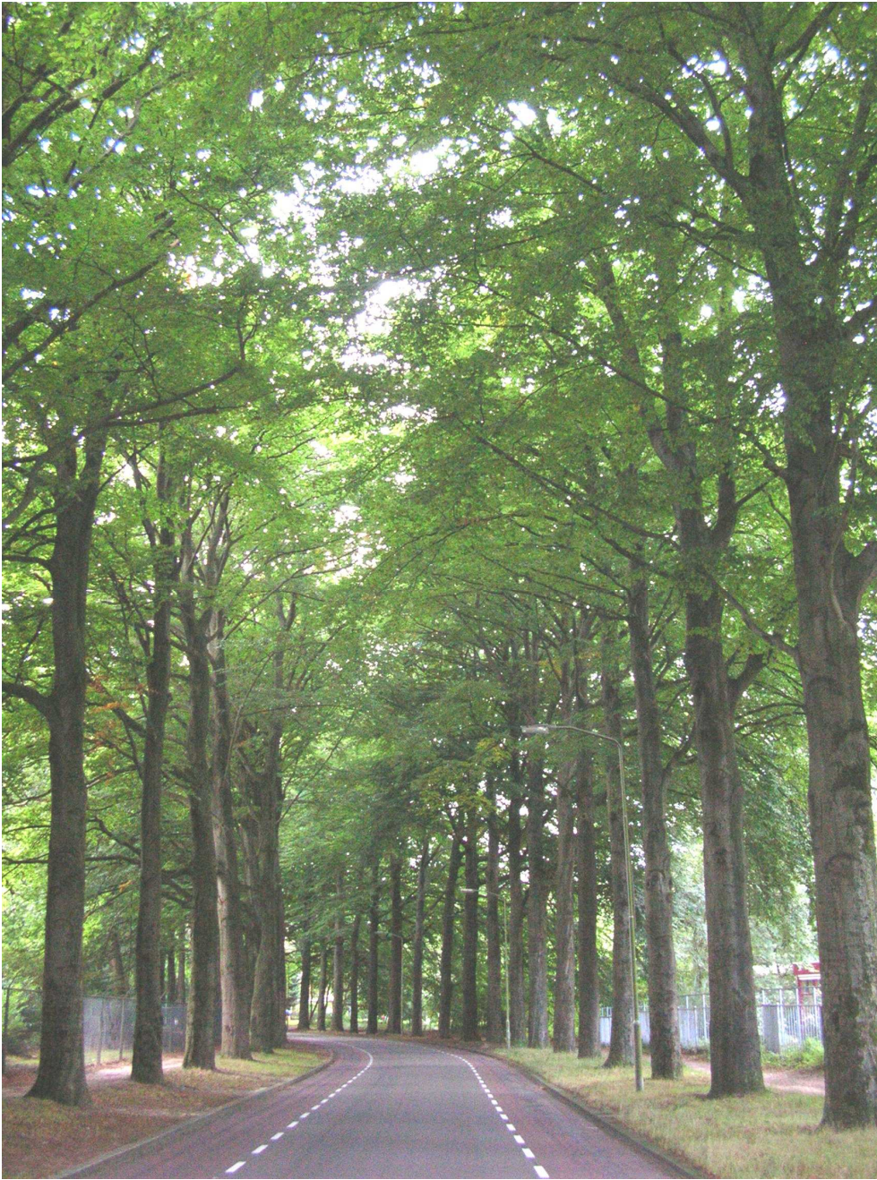
Ede-01. Laanbeplanting van beuk opgenomen in de categorie 'geselecteerd uitgangsmateriaal'.