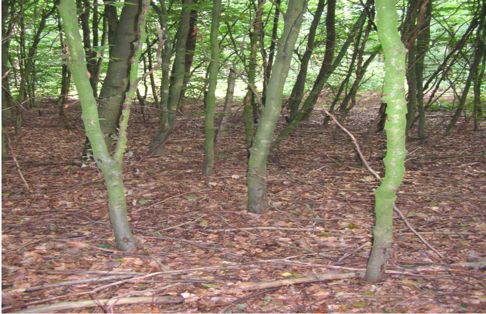
Sanoer: slechte herkomst Rhenen Grebbeberg.