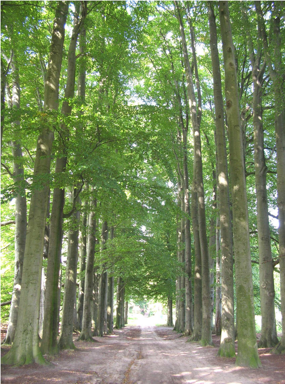
Velp-02. Laanbeplanting van beuk in de categorie 'geselecteerd uitgangsmateriaal'.