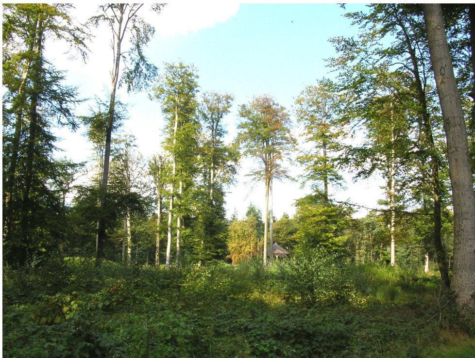
Barneveld-01. Beplanting van beuk in de categorie 'geselecteerd uitgangsmateriaal'.