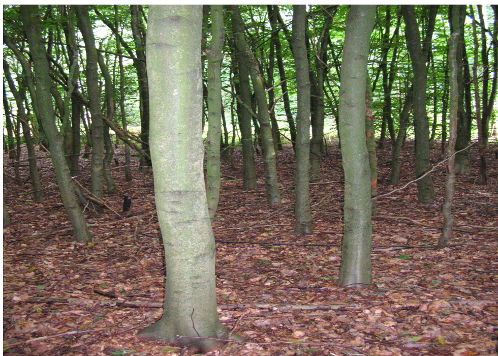
Sanoer: goede herkomst Park 't Loo-02.