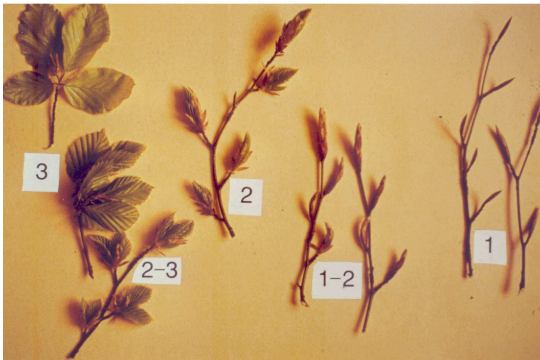
Figuur 3. Uitloopstadia van beuk naar foto afkomstig uit het EU-project FAIR3-CT96-1464 Beech Forestation.