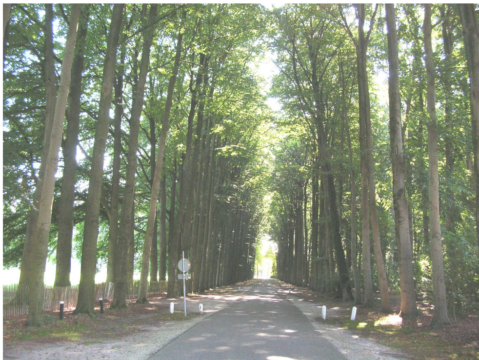
Park 't Loo-02. Laanbeplanting van beuk in de categorie 'geselecteerd uitgangsmateriaal'.